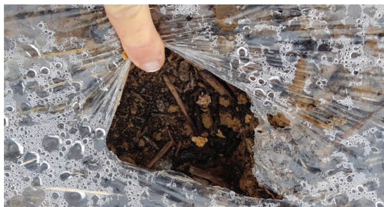
Mise en place des composts, en concentration sur la ligne de plantation de melon (SYNERGIES 2020 - ACPEL)

Rendez-vous en 2022, pour un article de synthèse de l'ensemble de ces travaux liés au projet SYNERGIES.